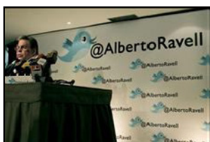
Imagen del ex director general de Globovisión, Alberto Federico Ravell, un ejemplo de marca personal a través de las redes sociales.