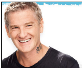
El empresario y político Francisco de Narváez, de origen colombiano, fue capaz de ganar al ex presidente Kirchner en la provincia electoral más importante de Argentina, gracias a un buen posicionamiento de su propia marca.