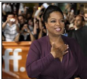
La productora ejecutiva estadounidense Oprah Winfrey llega a la alfombra roja para la proyección de la película "Precious", basada en la novela "Push" de Sapphire, el 13 de septiembre de 2009, en la versión 34 de Festival de Cine de Toronto (Canadá). Winfrey ha sabido conectar con un público tan diverso como el estadounidense.