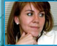
Mª Dolores de Cospedal

Quizá la más clásica del PP. La secretaria general no renuncia a las perlas y sus trajes son siempre elegantes pero sin estridencias.