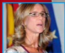
Cristina Garmendia La ministra de Ciencia e Innovación, suele lucir espectaculares vestidos. También destaca por el atrevido diseño de sus gafas.